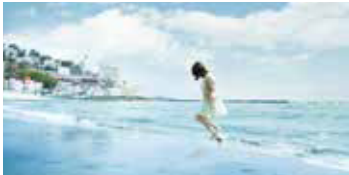
●熱海サンビーチ ヤシの木が並ぶ400m程の人工ビーチ。夏には、水上アスレチック「サンビーチウォーターパーク」も登場し、海水浴客で賑わいます。シーズンオフには爽やかな潮風を感じながらの散歩もオススメです。夜の砂浜ライトアップは幻想的な雰囲気。