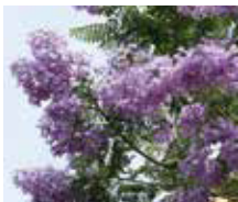
●ジャカラダ(花期:6月) 世界三大花木の一つ。南米産・ノウゼンカズラ科。紫色の花びらを葡萄のように房状に咲かせます。お宮緑地等で見られます。

自然・歴史・文化が溢れる風光明媚な湯の街 豊富な温泉と海の幸で身も心も癒される お問合せ：一般社団法人熱海市観光協会 TEL. 0557-85-2222