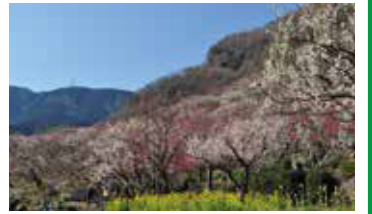
●湯河原梅林(幕山公園) 幕山山頂までのハイキングコースは四季折々の草花が咲き、自然の素晴らしい景色に癒されます。特に柱状節理の幕岩を背景とした梅林は圧巻で人気スポットです。2月上旬から3月中旬にかけて「梅の宴」が開催されます。