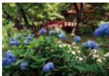
●熱海梅園 梅・桜・新緑・紅葉と年間を通じて楽しめる公園。6月上旬～中旬には園内を流れる初川をホテルが乱舞します。