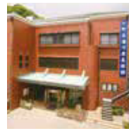
●町立湯河原美術館 日本画壇の第一線で活躍する画家・平松礼二画伯の作品を展示する「平松礼二館」をはじめ、常設館に竹内栖鳳、安井曾太郎の作品があります。