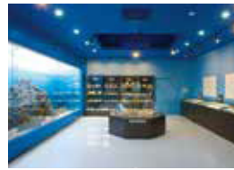
●小林展望公園パークゴルフ場 子供からお年寄りまで幅広い年代で楽しめるパークゴルフ場が展望公園にOPEN。バーベキュー場も併設されています。

真鶴半島は、樹齢350年以上といわれるマツやクスノキの巨木が生い茂る豊かな森と、多様な生き物が生息している海につつまれた自然の宝庫です。豊かな森は、「魚付き保安林」として大切に守られ、真鶴の新鮮な海の幸が美味しい理由です。森林浴で楽しむのもよし！磯遊びを楽しむのもよし！美味しい海の幸を楽しむのもよし！ゆったりとした時間の中で、お気に入りの時間を見つけてください。