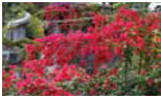
●ブーゲンビリア(花期:6月) レトロな喫茶店、飲食店が点在する糸川遊歩道にて見られます。