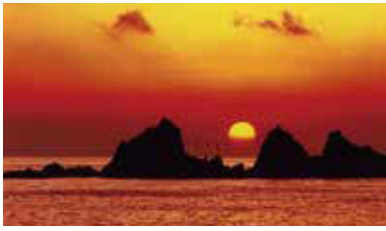
●三ツ石海岸 初日の出のスポットとしても有名な三ツ石海岸。

海の幸の宝庫、相模湾 とびっきり活きの良い地魚を味わいに真鶴へ お問合せ：真鶴町産業観光課 TEL. 0465-68-1131